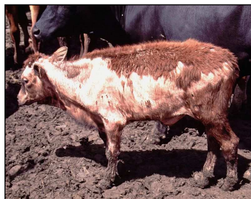
(3) Hårlaget kan også være en medindikator på dyrets sundhedsstatus.