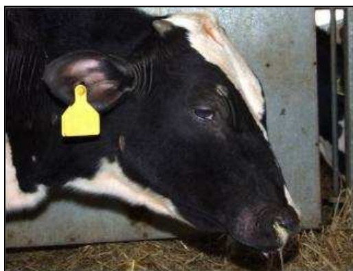
(2) Ko der er "mat i betrækket" – matte øjne, næsen løber og ørerne hænger. Hun har formentlig feber.