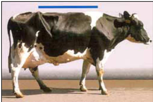
(1) Normal: Flad ryglinje, jævn gang med god skridtlængde.